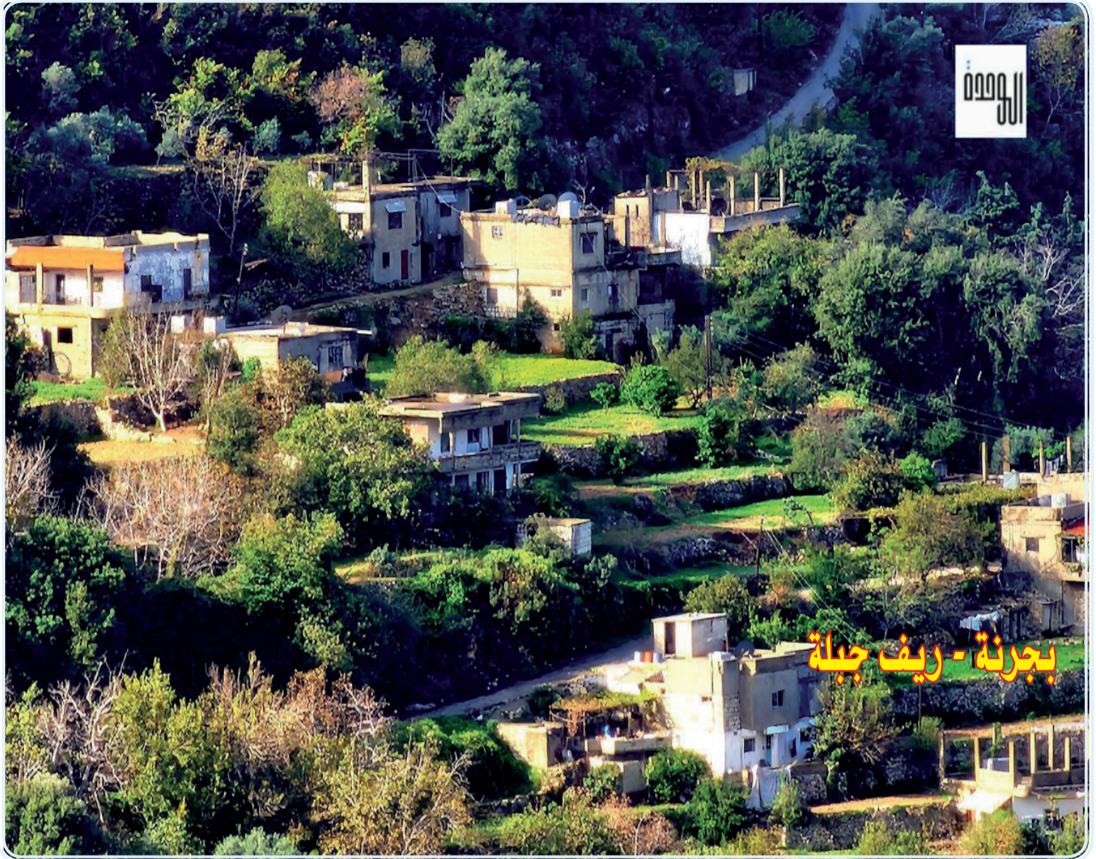
بجربة - ريف جبلة