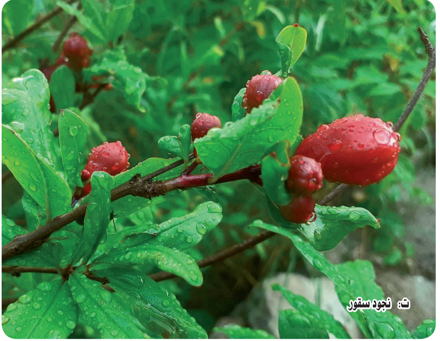
ت: نهود ستور

وكل ماهو جميل وبهي في هذا العالم البارد.