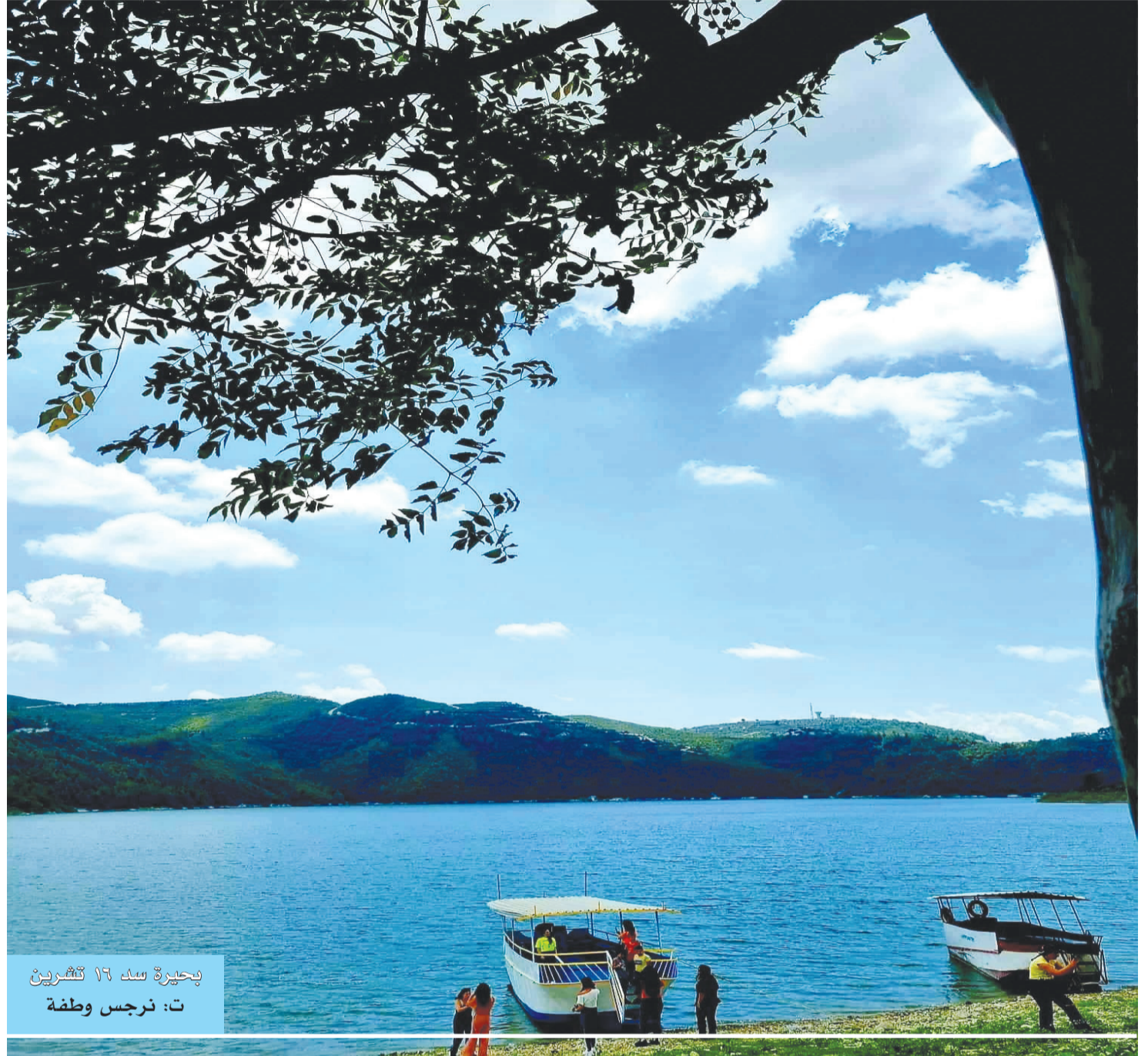
بحيرة سد ١٦ تشرين ت: نرجس وطفة

شام انعكاس لجمالنا الروحي والثقافي في زمن الماديات الذي بتنا نفتقد فيه إلى توسيع مرجعياتنا وتطهيرها مهما كبرنا !!