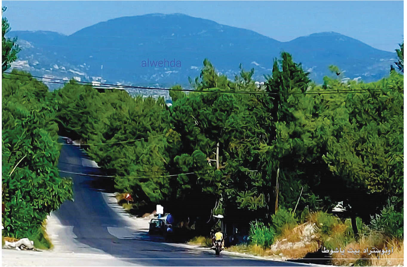
أوتوبسترد بيت ياشوط

موسم زيتون وافر يحمل كل الخير هذا العام، نرجوه عام فرح و رحمة على هذا الشعب الأبوي بكل تفاصيل حياته و تفاعله الراقي و الإنساني مع الحياة.