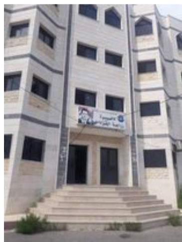
الزراعية والأسرية متناولة في ندواتها إضافة إلى الزيتون وطرق تخليله،

الحمضيات والحديقة المنزلية وصناعة المقطرات والصابون، أما في شعبة الثروة النباتية فقد تم افتتاح معاصر الزيتون في المنطقة مع بداية موسم القطاف وقد تم تعميم التعليمات الفنية لعصر الزيتون للحصول على زيت زيتون عالي الجودة، حيث تم تنفيذ جولات على سبع معاصر في المنطقة من أصل ١٣ معصرة عاملة، وفي شعبة الوقاية ذكر الدكتور يوسف أنه يتم الاستمرار في حملة مكافحة ذبابة الفاكهة على الحمضيات والعوائل الأخرى مع مراقبة ظهور الآفات على الحمضيات والإبلاغ عنها مع الاستمرارية بمكافحة ذبابة الزيتون. أما في شعبة الإنتاج الحيواني فقد